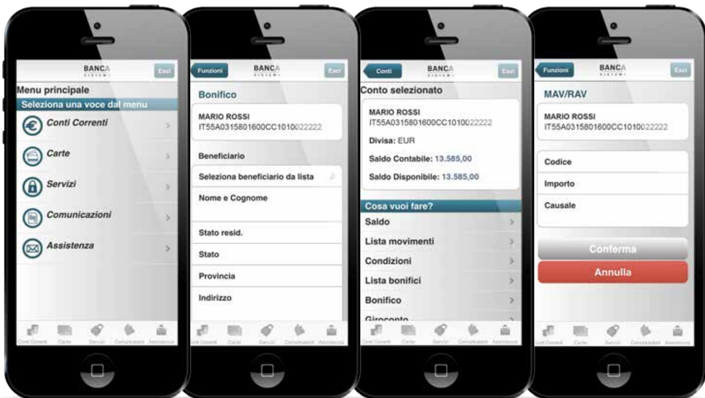
Alcune sezioni della nuova APP di Banca Sistema, presto disponibile gratuitamente negli Store di Apple e Google.