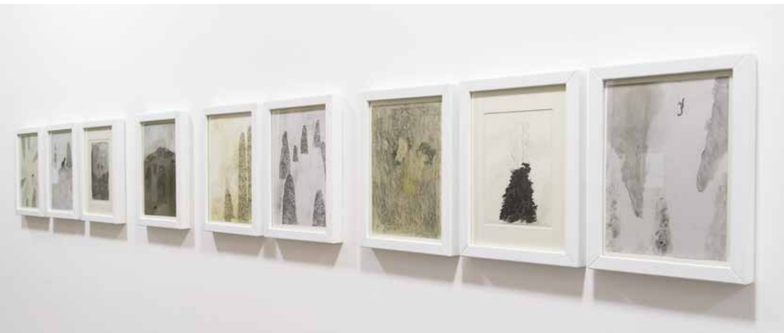
Elisa Bertaglia, Bluebirds #2 - Tecnica mista su carta | Mixed technique on paper - dimensioni variabili | variable sizes - 2014

Entrance upon invitation (for information: Tel. +39 02 802801).